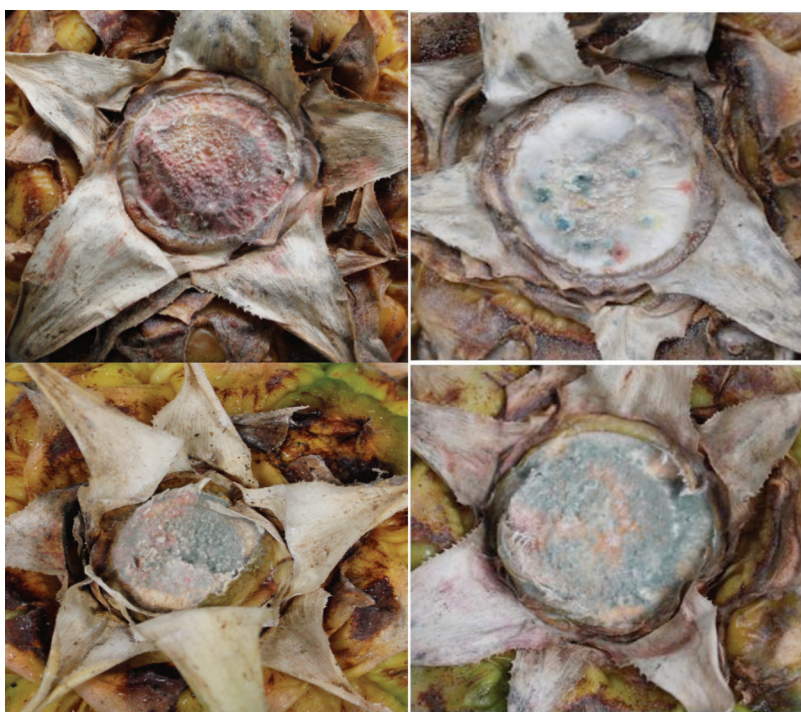
Fig. 1. Crecimiento de los mohos más frecuentes en el pedúnculo de frutos de piña de Puntarenas y Sarapiquí.

mencionadas, presentó una frecuencia mayor al 20%. En la Figura 1 se observan ejemplos de crecimiento en el pedúnculo de los principales