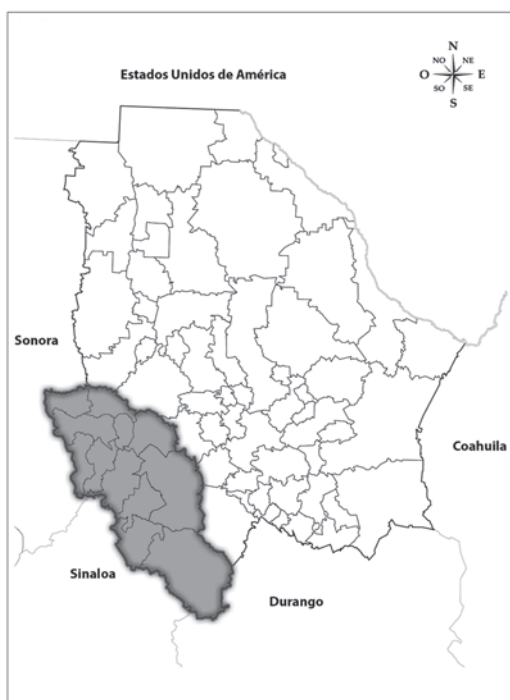
Figura 2. Mapa que muestra los municipios del estado de Chihuahua, México, que presentan condiciones de latitud y altitud (INEGI, 2014) favorables para el cultivo de moringa.